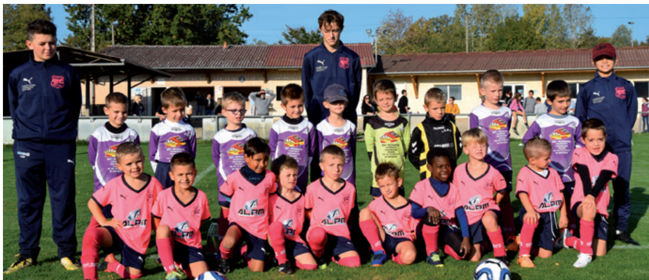
U7 Veyle Saône

Au-delà de la notoriété acquise à travers les excellentes saisons réalisées par l'équipe Fanion qui évolue au niveau Régional depuis 10 ans maintenant (avec notamment un 7 e Tour de Coupe de France face au Dijon FCO), le Club investit largement dans la formation de ses jeunes qui représentent plus de 75% des effectifs.