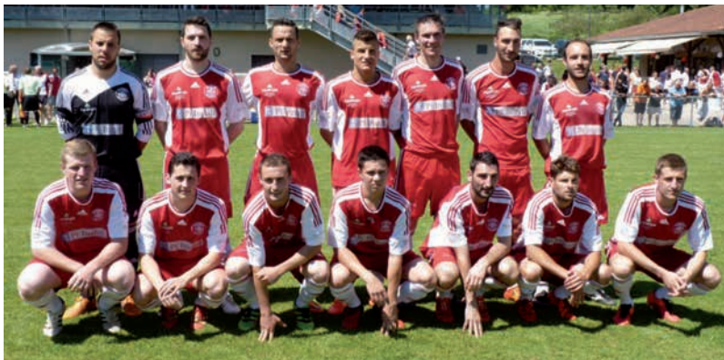
Equipe Fanion lors de la dernière journée de R2 saison 2016-2017 avec le titre de champion

Pour continuer à alimenter ses équipes seniors, l'ESB Foot Marboz doit sans cesse se remettre en question pour pouvoir