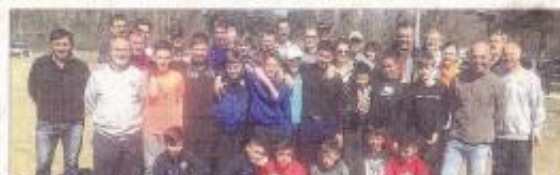
À la fin de la matinée, les "nettoyeurs" se sont rassemblés au stade de Villieu-Loyes-Mollon.