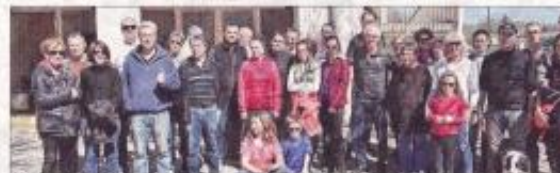
70 personnes étaient au rendez-vous à Saint-Maurice-de-Gourdans.