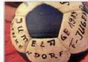
Der Ball, der überreicht wurde.

Am Sonntagmorgen stand für die Gäste ein Besuch im Denkendorfer Freibad an, den vor allem die Kinder nach dem anstrengenden Vortag sichtlich genossen. Am Nachmittag fuhr der Bus nach Meximieux wieder ab. Vor der Abreise überreichten die Gäste aus Meximieux einen Fußball, den Fußballer vor 30 Jahren mit nach Meximieux genommen haben. Die damalige F-Jugend-Mannschaft hat sich mit Unterschriften darauf versorgt.