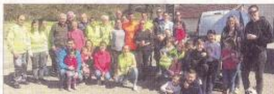
Les Bourroirs étaient mobilisés pour le nettoyage de printemps.