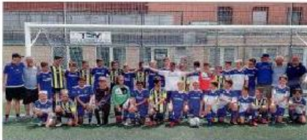
Die D-Jugend beim Deutsch-Französischen Fußballaustausch.