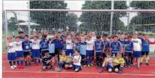
Die E-Jugend im Denkendorfer Stadion.