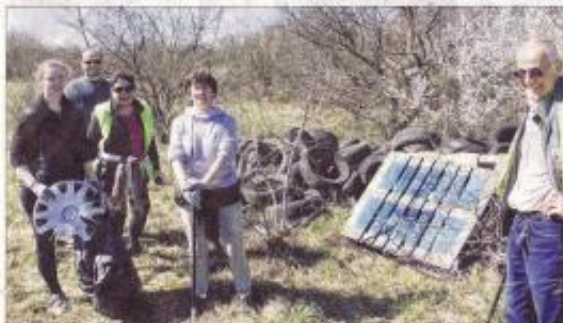
Une équipe de nettoyage devant un volumineux tas de pneus. La municipalité de Loyettes devrait se charger de l'enlèvement.

Finis les ordures en pleine nature. Samedi, les cinq communes ont organisé leur nettoyage de printemps. Équipés de sacs et de gants, élus, habitants et enfants ont sillonné les routes et les chemins, passé au peigne fin les voies ferrées et les berges de l'Ain, du Longevent, du Mollon, ou encore celles de l'étang de Meximieux. Plusieurs dizaines de mètres cubes ont ainsi été ramassés. Globalement, « chaque année, le nettoyage est plus facile, a expliqué Marie-Claude Regache, responsable de la journée à Saint-Maurice-de-Gourdans. On trouve moins de gros objets. » Les volumes collectés ont tendance à baisser d'année en année. Ils ont toutefois augmenté à Loyettes.