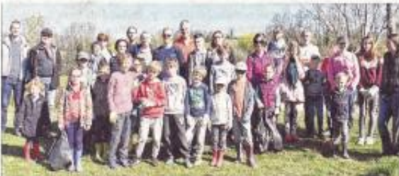
Les habitants de Meximieux, prêts pour une matinée propreté.