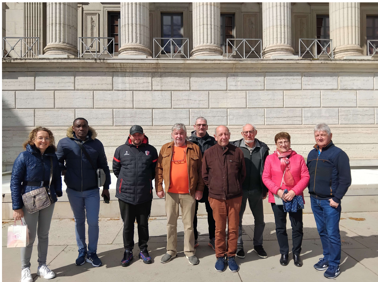
Vous pouvez compter les 24 colonnes